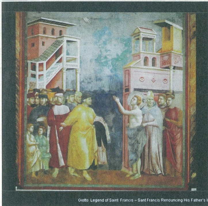
Giotto. Legend of Saint Francis – Saint Francis Renouncing His Father's Inheritance

kifejezések Ferenc halála után nem sokkal a pápai dokumentumokban jelennek meg.